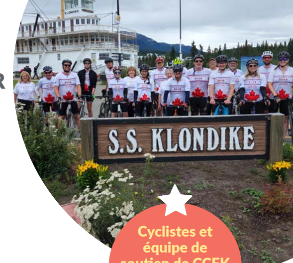
Cyclistes et équipe de soutien de CCFK au S.S. Klondike, Whitehorse (Yn), 2022

Canada Cycles for Kids (CCFK) soutient notre cause depuis longtemps. Fondée par Rob Fetherstonhaugh et Marc Balevi en 2002, cette activité annuelle attire les cyclistes de partout au pays et vise à soutenir les enfants malades et leur famille. Au cours des 20 dernières années, CCFK a amassé près de 1,5 million $ pour la réalisation de rêves.