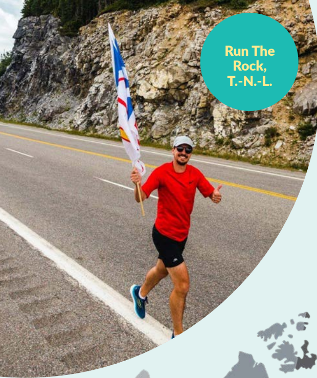
Run The Rock, T.-N.-L.